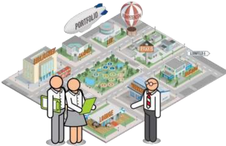
Abbildung 3-2: Sifa-Lernwelt