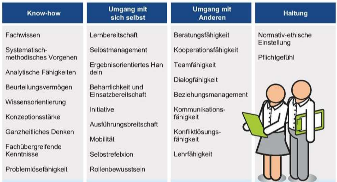
Kompetenzen einer Fachkraft für Arbeitssicherheit

Das Kompetenzprofil der Fachkraft für Arbeitssicherheit beinhaltet neben den Kompetenzen jeweils auch eine Auflistung von Teilkompetenzen. Die einzelnen Kompetenzen lernen Sie während der Qualifizierung kennen und erweitern diese.